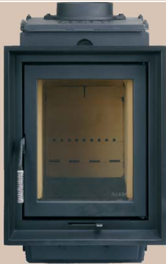
JUWEL H1 E